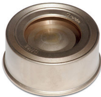
Typ F-M (Messingteller)