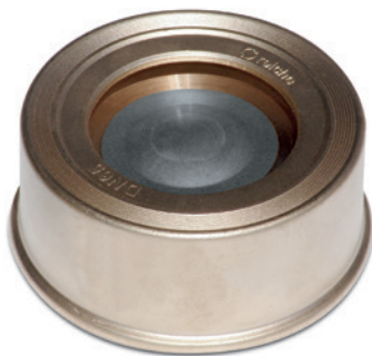
Typ F-N (Niroteller)