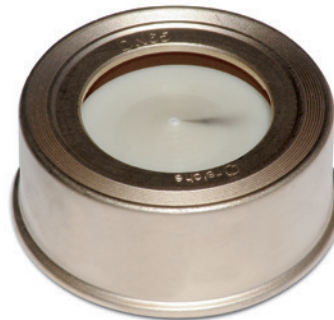
Typ F-K (Kunststoffteller)